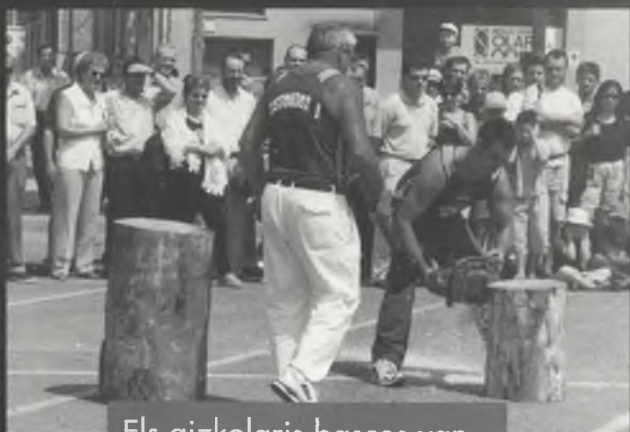
Els aizkolaris bascos van demostrar la seva força i habilitat aixecant peses, fent anar la destral, amb el xerrac i amb la motoserra.