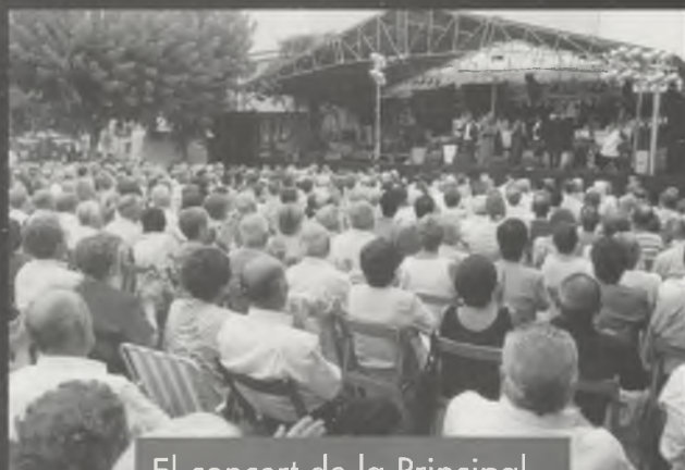
El concert de la Principal de la Bisbal va omplir el pati de la Farga.