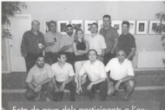
Foto de grup dels participants a l'exposició organitzada per l'Agrupació Fotogràfica de Salt.