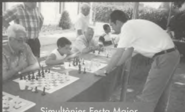
Simultànies Festa Major 2001.