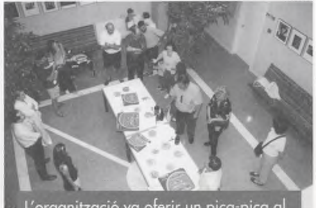
L'organització va oferir un pica-pica al públic assistent a la inauguració de l'exposició "20 per 20", feta a l'Hotel d'Entitats les Bernardes.