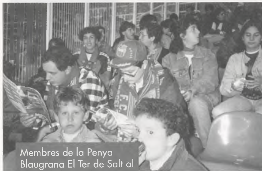
Membres de la Penya Blaugrana El Ter de Salt al camp de la Reial Societat.