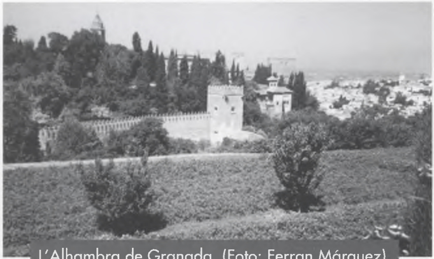
L'Alhambra de Granada.

El dijous 14 de juny al matí vam visitar el poble de Mijas, que és molt atractiu pels vestigis que conserva dels 8 segles que va passar sota domini àrab, com tots els altres pobles de la zona. Cal destacar la muralla, els jardins dissenyats perquè tot l'any hi hagi flors, el mirador, l'ermita de la Virgen de la Peña, patrona de Mijas, excavada