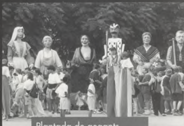
Plantada de gegants.