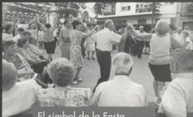
El símbol de la Festa Major: la sardana.