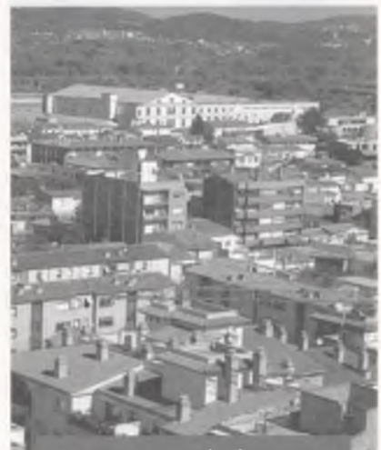
Plaça de la Constitució, actualment plaça de la Vila. Plaça de la Vila.