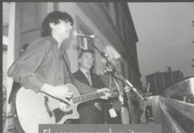
El pregoner amb guitarra.