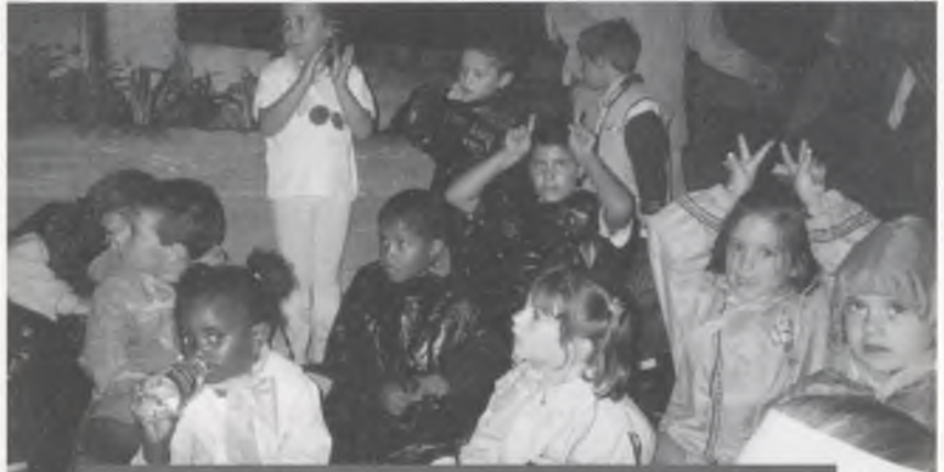
Visita al zoo de Barcelona dels Casalets Infantils de Salt el 17 de juliol del 2001.

l·listat de mancances, que es transcriu a la part final d'aquest text, ha presentat també unes propostes i demandes molt concretes com: fer de Salt una zona única de matriculació i d'escolarització, augmentar els recursos (EAP, Serveis Socials, Centre d'Estimulació Precoç,...), augmentar la formació ocupacional, ampliar l'oferta de cicles formatius, vetllar per l'absentisme i actuar per paliar-lo, ..., en resum, aplicar polítiques educatives que tinguin com a objectiu suprimir la guetització i equilibrar l'escola pública i concertada.