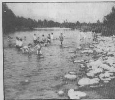
El riu Ter al seu pas per Salt, el temps en què encara ens hi podíem banyar.

En els escrits que ha fet públic la Comissió per la Independència, s'entrevina que és una qüestió que els preocupa. Aquesta Comissió d'entrada, hauria complert el seu mandat una vegada convocades les eleccions municipals... però els preocupa aquest futur, i per això intenten promoure tota mena d'estudis que serveixin de base al nou Ajuntament.