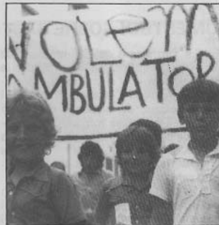
Primera manifestació autoritzada a les comarques gironines; a Salt, campanya "Volem un ambulatori" organitzada per l'Associació de Veïns. Any 1976.

És una documentació feta amb presses, compleix ben just el compromís d'aquest amb la Comissió d'Independència. Hi ha molts errors de càlcul, que denoten una falta de rigor en l'elaboració. La proposta que es fa diu: "La independència municipal NO ÉS LA ÚNICA solució". Com podem endevinar, la incògnita està en saber quines són les solucions proposades.