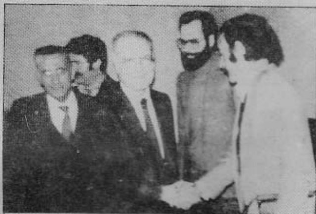
El President del Parlament donà esperances sobre l'acceleració del procés d'independització de Salt.