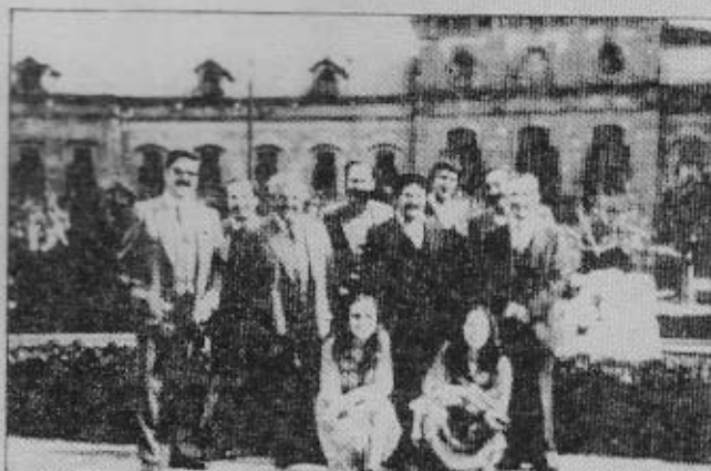
Els membres de la comissió per la Independència de Salt, amb el diputat Salvador Sunyer, davant l'edifici del Parlament de Catalunya.

Heribert Barrera s'entrevistà amb la Comissió per a la Independència de Salt