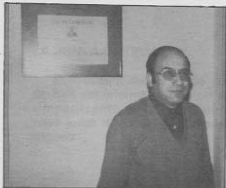
... Tripletes classificades a primer i segon lloc del Concurs de Jubilats