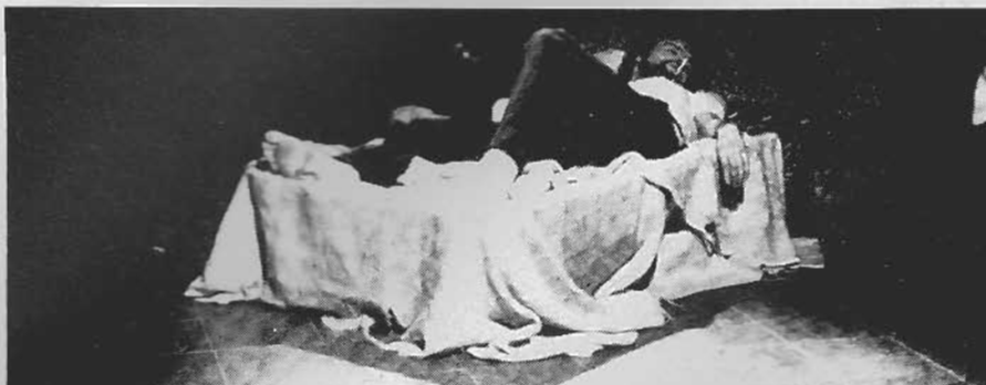
Després dels assajos, aquesta és la situació en què es troben els membres del Talleret. Abaltats, fumen i esperen unes solvents com que no arriben. «Què ajuda al teatre? Qui els treu aquesta nyonya?»

Finalment, i atenent a la importància que en algunes zones de Catalunya té el teatre d'aficionats, el Servei de Teatre ha posat a disposició de tots els grups, en la seu dels seus respectius Serveis Territorials, gairebé la totalitat de textos teatrals en català existents (tant d'autors catalans com traduccions) perquè aquests grups tinguin a l'abast un catàleg prou extens de possibilitats de muntatges.